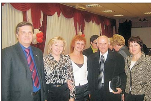
2009 г. Члены Педагогического клуба «Учитель» с академиком Ш.А. Амонашвили

Гуманная педагогика и профессиональные победы учителей