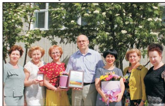
2016 г. Администрация школы