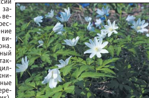
Ветреничка алтайская (лат. Anemonoides altaica)

нут редкими, как в соседних регионах. Поэтому, чтобы не нанести вред редким растениям, лучше вообще ничего не срывать, а только фотографировать.