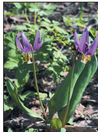
Кандык сибирский (лат. Erythronium sibiricum)

Начать надо с того, что официально в научной литературе термин «подснежник» закреплен за родом Galanthus семейства Амариллисовых, которое ему присвоил великий систематик Карл Линней в 1753 году. В роду порядка 20 видов, но самый распространенный и известный в Европе Galanthus nivalis — подснежник белоснежный. Он по-настоящему может считаться эталоном весеннего первоцвета, который появляется словно из снега. Галантус — раннецветущее, массовое растение, но главное — у него очень нежные, очень белые, сильно поникающие, каплевидной формы венчики, которые очаровали до тошного Линнея, и он назвал его по-гречески «Галантус нивалис», т.е. молочный цветок снежный.