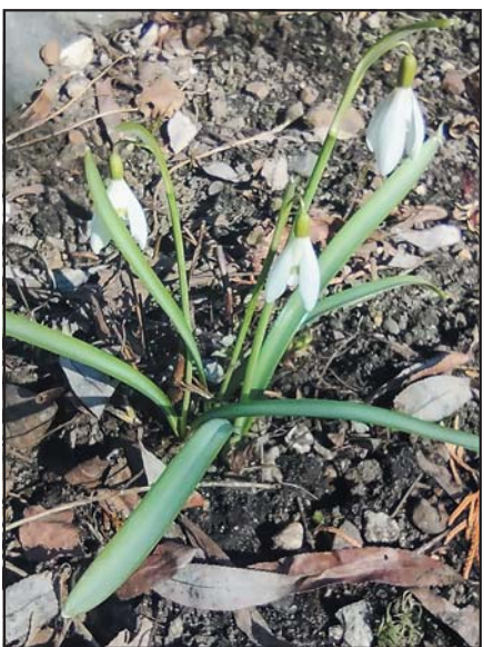
Подснежник белоснежный (лат. Galanthus nivalis)

Цветок среди снега, как Божий посланник, Являет и чудо, и свет! Благой красотой из холодных проталин Встречает весну первоцвет!