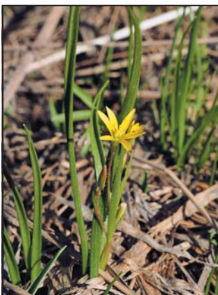
Гусиный лук Федченко (лат. Gagea fedtschenkoana)

Но все ли раннецветущие растения можно отнести к подснежникам? Может, это просто название определенного растения? Тогда почему это название имеет широкое распространение?