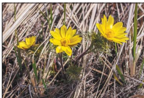
Адонис весенний, или горичвет (лат. Adonis vernalis)

Вот такие метаморфозы происходят с названием «подснежник» — от чисто белого цветка или ярко-желтого до синего и фиолетового, от склоняющегося до раскрывшегося, смотрящего прямо в небо. И если в Европе это единственный вид, однозначно понимаемый галантус, то на просторах России так могут называть какой угодно первоцвет, хоть бы и мать-и-мачеху, никто не поправит.