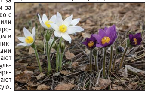
Прострел, или сон-трава (лат. Pulsatilla patens)

нут редкими, как в соседних регионах. Поэтому, чтобы не нанести вред редким растениям, лучше вообще ничего не срывать, а только фотографировать.