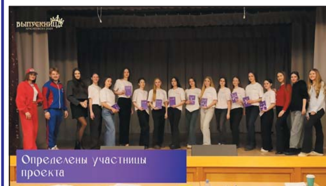
Определены участницы проекта

Этой весной мы открываем новый сезон самого долгожданного, нежного и грациозного проекта Краснообска