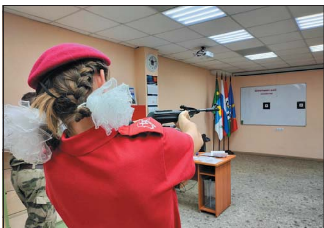
Ребята достойно преодолели все испытания и набрали необходимое количество баллов!

Торжественное награждение курсантов, успешно прошедших Всероссийский Юнармейский норматив, состоялось в Доме культуры Краснообска 3 декабря.