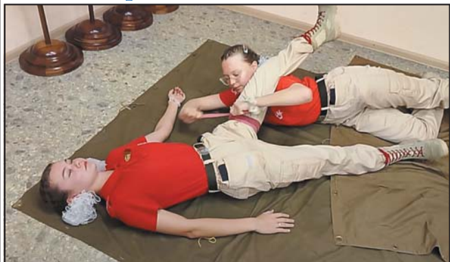
15 ноября юнармейцы общеобразовательных учреждений Краснообска и Ленинской школы № 47 приняли участие в сдаче Всероссийского Юнармейского норматива.