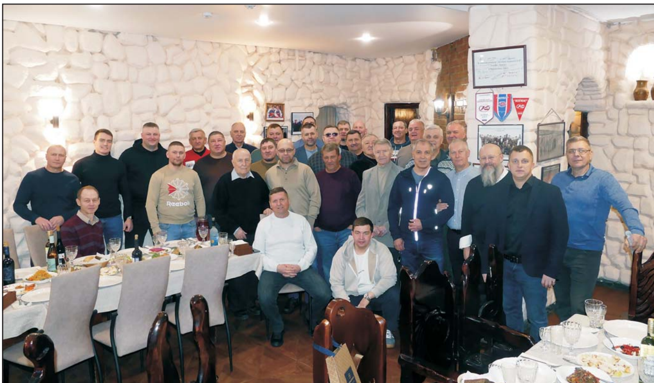
«Бойцы вспоминают минувшие дни...». На праздновании клуба собрались как ветераны краснообского хоккея, тренерский состав клуба, так и нынешняя хоккейная молодежь

На трибуне хоккейного турнире между командами «Колос» (Краснообск) и «Родина» (Новосибирск).