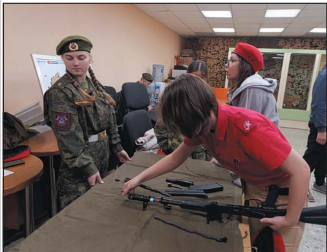
Сдача проходила на базе ВСПК «Б.А.Р.С.» Краснообск. Были сданы зачёты по нескольким дисциплинам: