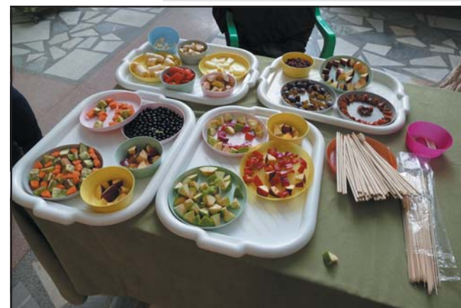
«Спортивное питание». Appetитный прикорм, используемый для стимуляции «спортсменов»