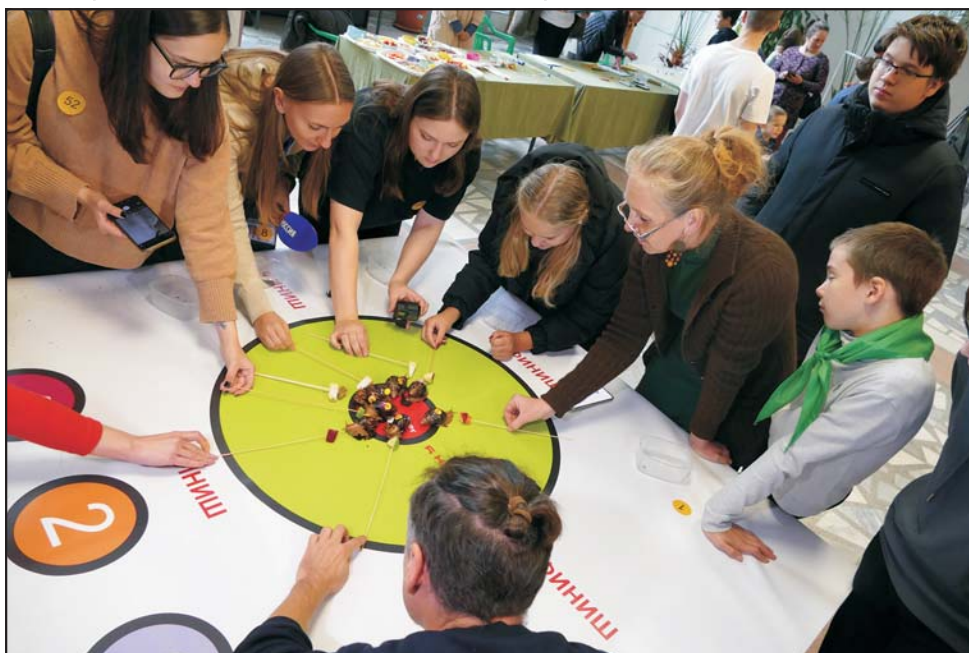
За гоночным столом. Азарт проявляли не сами «спортсмены», а их владельцы

Помимо самих гонок улиток на мероприятии прошли мастер-классы (лепка, рисование), викторина для школьников 6–11