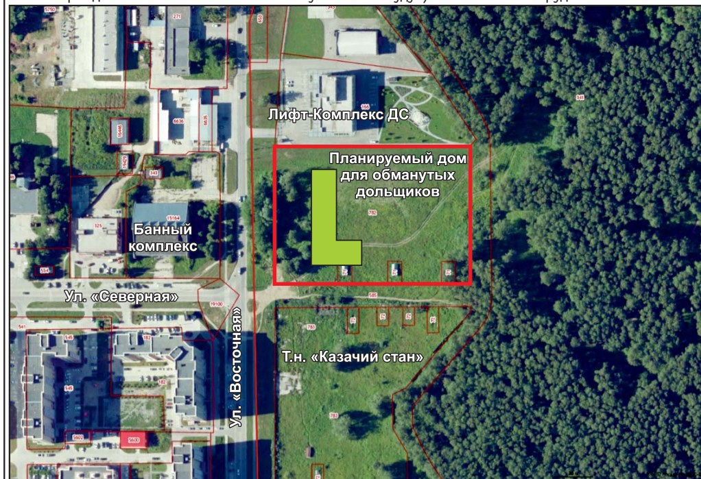
Если жилой дом разместится на опушке леса, это вызовет повышенную антропогенную нагрузку на Краснообскую рошу, — так считают активисты экологического движения. Уже сейчас рошу «освоили» снегоходчики и квадроциклы, оглашая рёвом моторов и покрывая гарью выхлопов тихие и уютные прежде лесные тропинки. Власти признают, что в условиях нынешнего статуса Краснообской роши юридически повлиять на мотогощики невозможно. И уж точно не получится урезонить пеших загрязнителей и поджигателей лесного массива.

Для восстановления прав обманутых дольщиков необходимо привлечь власти уровня района или сразу региона. Но для того, чтобы те снизили до нас и вошли в положение, необходим определённый уровень доверия, согласия и взаимопонимания. Имеется ли таковая — это могут показать лишь дальнейшие события. А пока ясно одно: в поселке назревает серьёзный конфликт, причиной которого может стать еще не построенный «дом у леса».