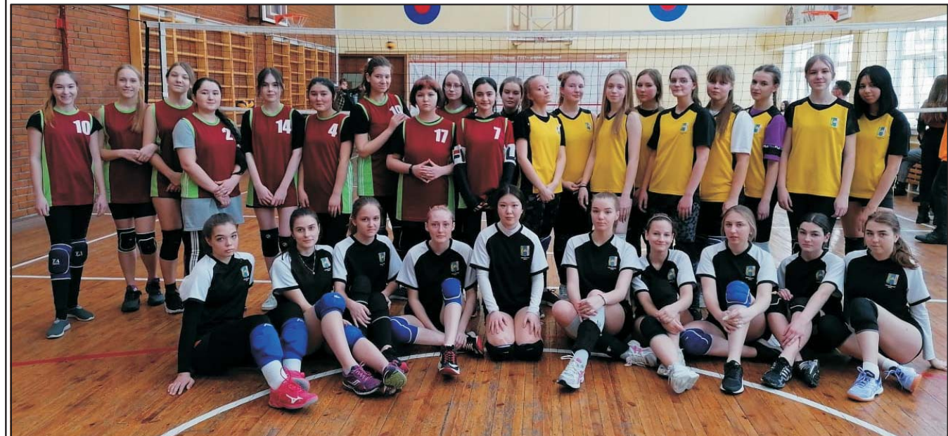
Воспитанницы ДЮСШ «Академия»

Следует отметить, что в рамках выполнения нормативов проходит проект «Всея семьей в ГТО», по итогам которого выполнившие нормативы семьи получат кубок и благодарность от Центра тестирования ДЮСШ «Академия».