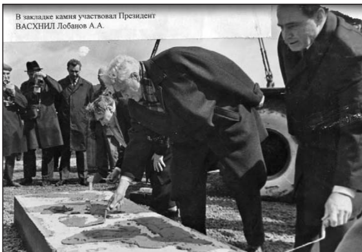
В закладке камня участвовал Президент ВАСХНИЛ Лобанов А.А.

14 апреля 1970 была проведена торжественная закладка посёлка как места жительства научных сотрудников Сибирского отделения ВАСХНИЛ, которая была приурочена к 100-летию юбилею В.И. Ленина. Расположен посёлок между Советским шоссе и лесным массивом Обской поймы на левом берегу Оби, между Кировским и Советским районами Новосибирска.