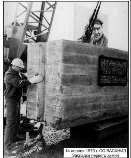
14 апреля 1970 г. СО ВАСХНИЛ Закладка первого камня

На нем прикрепили доску с указанием, что строительство научного городка начато в 1970 году и посвящено столетию со дня рождения Владимира Ильича. Рядом с блоком была установлена деревянная трибуна (после торжества ее сняли) и высокий металлический флагишток в виде колоса с 16 флагами — СССР и всех союзных республик. На металлической ленте этого сооружения написано, что строительство ведется на средства, заработанные трудящимися СССР на Ленинском юбилейном субботнике. На торжестве закладки первого камня прибыли Президент ВАСХНИЛ П.П. Лобанов, начальник Главного управления сельскохозяйственной науки МСХ СССР член-корр. ВАСХНИЛ Н.И. Володарский.