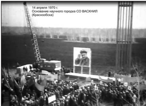
14 апреля 1970 г. Основание научного городка СО ВАСХНИЛ (Краснообска)

Проект был разработан ГИПРОНИИ АН СССР (авторы проекта — А. Панфил, Ю. Платонов, А. Карпов, Э. Судариков, Г. Тюленин), и включал в себя научно-исследовательскую с учебной базой, жилую и общественную зоны. Строительство было отнесено к Всесоюзным комсомольским стройкам.