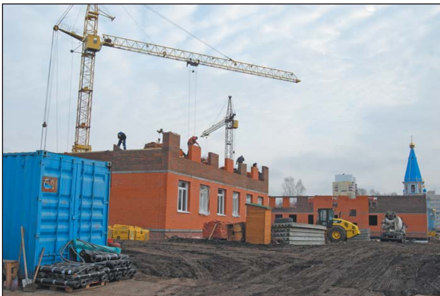
А тем временем строительство новой школы вырвалось из стадии фундаментных работ и решительно набирает обороты в возведении этажей школьных зданий.