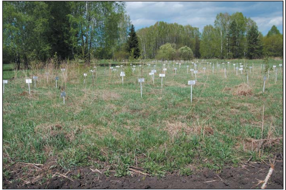
Неудивительно, что оформление Аллеи ветеранов вызывает у непосвященных людей странные ассоциации...

Другая же часть собравшихся, не согласных с решением руководства, расстроив-