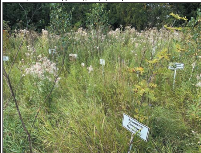
Таблички с дорогими именами по осени «тонут» в бурьянах некошеной травы...

в Кривошеково, где часто гуляют родители с детьми, пешеходы, грибники. Я пыталась расспросить прохожих: «как вы думаете, что это такое?». Одни говорили: «вероятно, это какие-то посадки, рассадник, питомник и т.д.» А были и такие: «вероятно, это захоронения отсидевших уголовников, у которых нет родственников!!!».