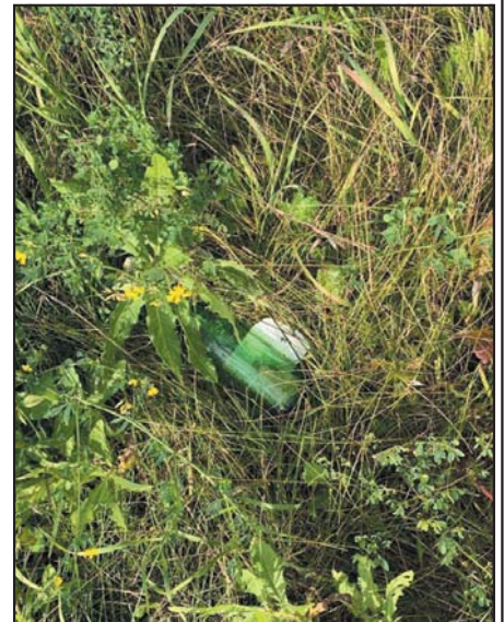
Разбросанная то там то тут стеклотара придает дополнительный «колорит» мемориальному месту

Рядом с этими полянами проходит пешеходная дорожка через парк