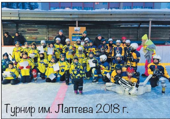
Турнир им. Лаптева 2018 г.